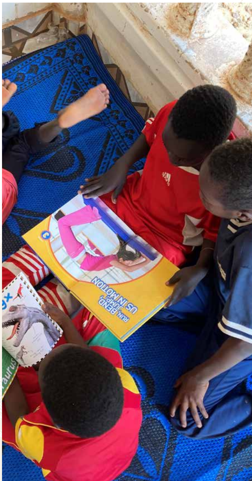
Un grupo de estudiantes leyendo juntos en la Biblioteca.