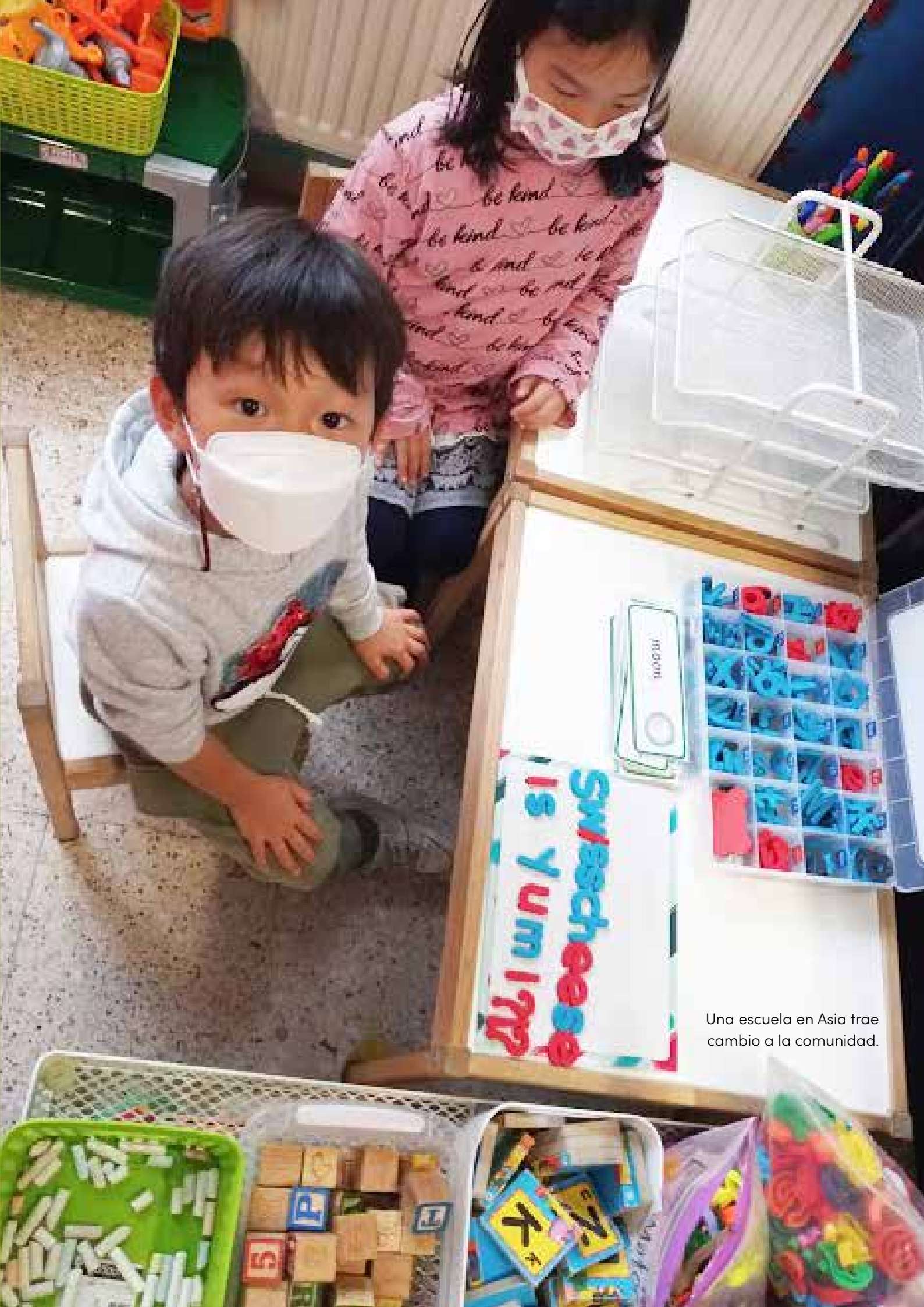
Una escuela en Asia trae cambio a la comunidad.