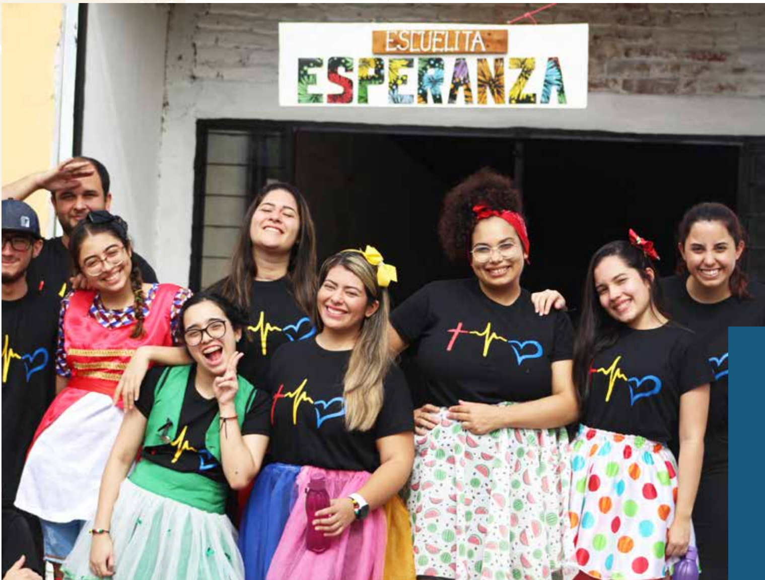
Celebraciones de escuela en Uruguay.