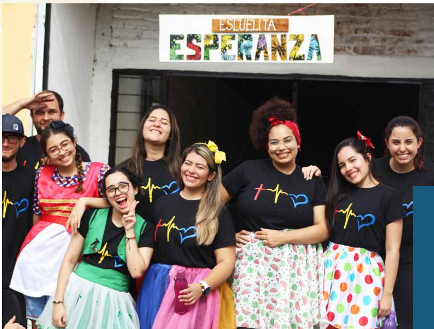
Célébrations d'école en Uruguay.