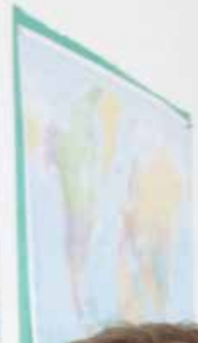
Les leçons au tableau dans une salle de classe à Bucharest Christian Academy.