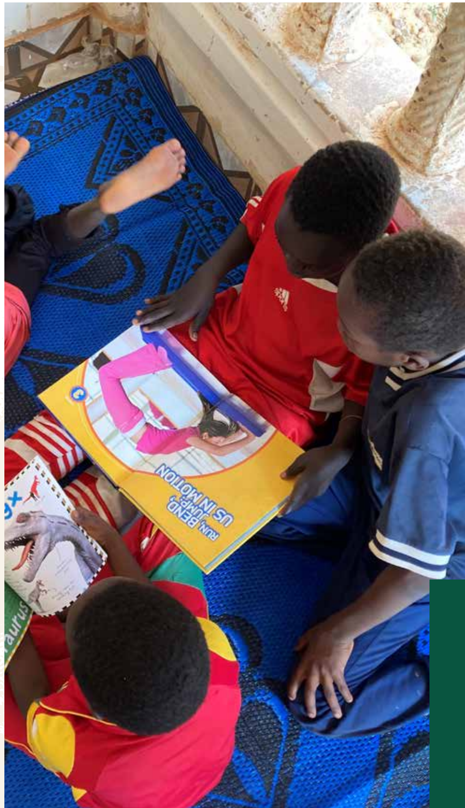
Un groupe d'élèves lit ensemble dans la bibliothèque.